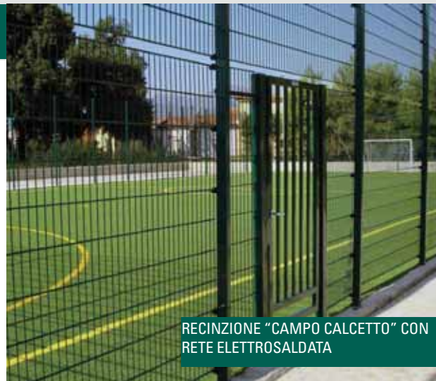
RECINZIONE "CAMPO CALCETTO" CON RETE ELETTRICALDATA

Venturelli Romolo srl garantisce sulla qualità dei materiali utilizzati, sul design degli attrezzi sportivi, sul rispetto delle norme di sicurezza e sui regolamenti tecnici di ogni singolo sport ed in particolare sul servizio pre e post vendita.