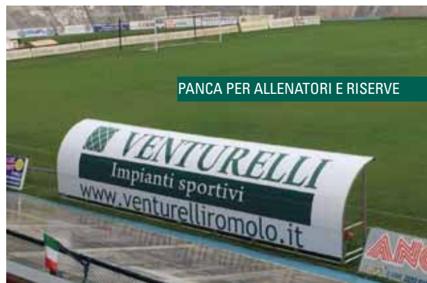
PANCA PER ALLENATORI E RISERVE