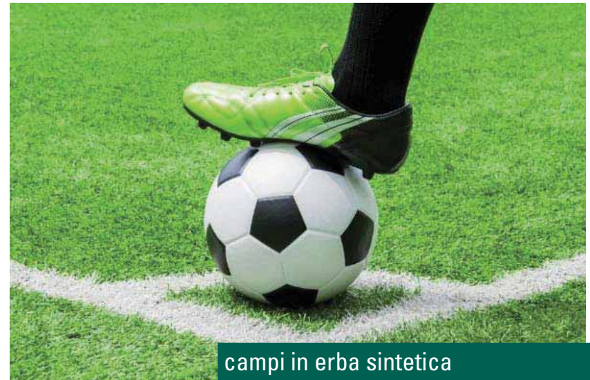
campi in erba sintetica

La possibilità di utilizzo senza limiti in qualsiasi condizione geografica e climatica, unitamente alle ridotte esigenze di manutenzione, rendono particolarmente vantaggioso l'investimento nei nostri manti.