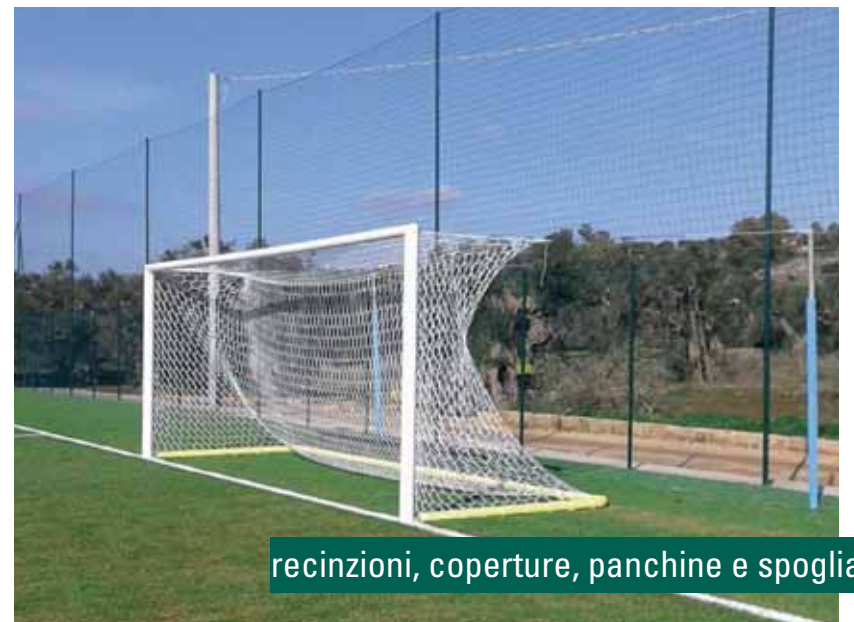
recinzioni, coperture, panchine e spogliatoi