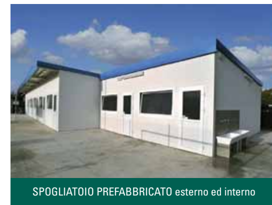
SPOGLIATOIO PREFABBRICATO esterno ed interno