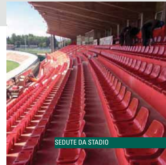
SEDUTE DA STADIO