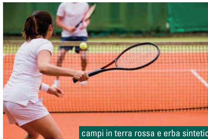
campi in terra rossa e erba sintetica