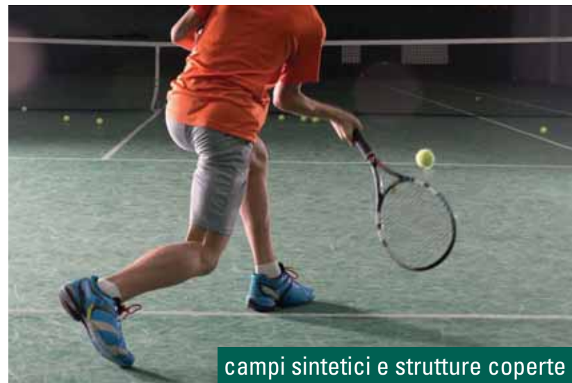
campi sintetici e strutture coperte

La possibilità di utilizzo senza limiti in qualsiasi condizione geografica e climatica, unitamente alle ridotte esigenze di manutenzione, rendono particolarmente vantaggioso l'investimento nei nostri manti.